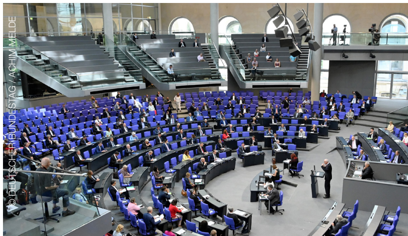
Der Bundestag als letzte Hürde: Das VOASG soll verabschiedet werden.

Die ABDA wird in das Jahr 2021 mit einem neuen Spitzenteam gehen. Die Bundesapothekerkammer wählt am 26. November einen neuen Präsidenten, und eine Woche später kürt die DAV-Mitgliederversammlung ihren neuen Vorsitzenden (2. Dezember). Die ABDA folgt dann am 9. Dezember mit der Wahl ihres Präsidiums. /