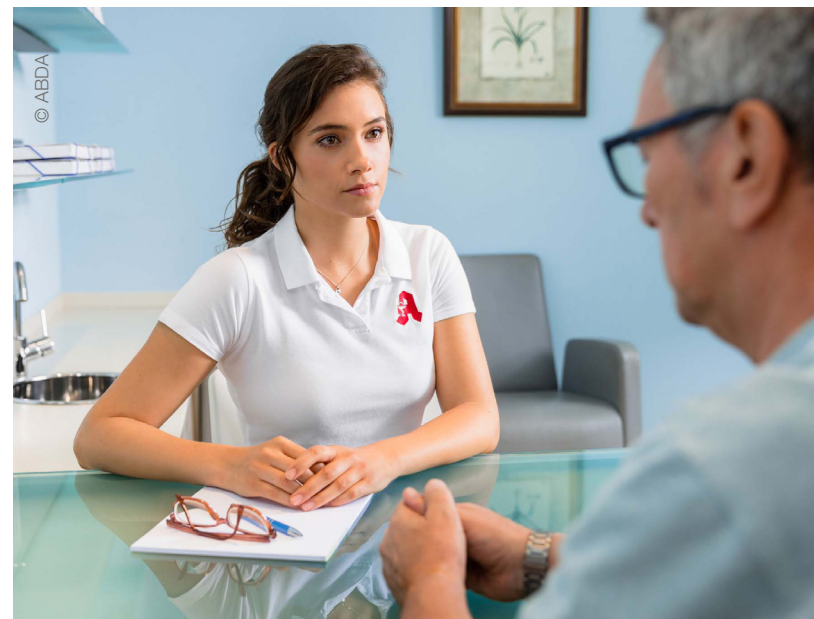
Der Gesprächsleitfaden soll Apotheker dabei unterstützen, Warnzeichen zu erkennen.